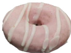
พบรอยที่เกิดจากการวางชิ้นโดนัทติดกัน