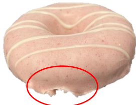
ช็อกโกแลตโคตติงเคลือบไม่ถึงฐานโดนัท, ไม่ทั่วชิ้น หรือพบรอยแตกบริเวณฐานโดนัท