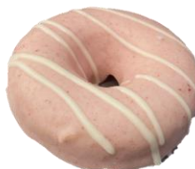
ช็อกโกแลตโคตติงผิวไม่เรียบ และ/หรือ พบรอยแตกร้าว