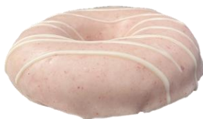
พบชิ้นโดนัทเปียว หรือ เอียง