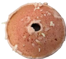
พบช็อกโกแลตโคตติงที่ด้านล่างของชิ้นโดนัท